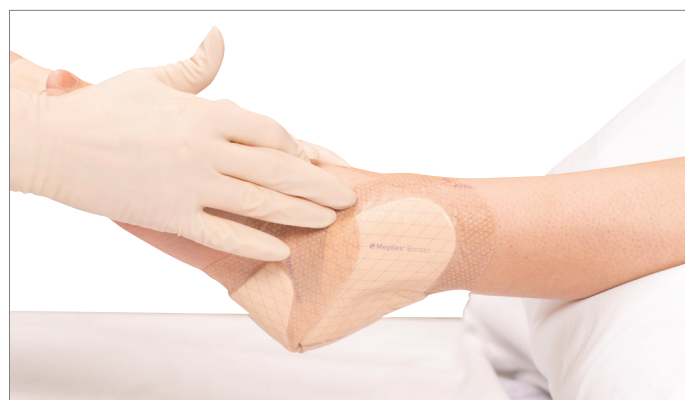
5. Confirmer que le pansement est remis à sa position d'origine, en veillant à ce que la bordure est intacte et à plat.