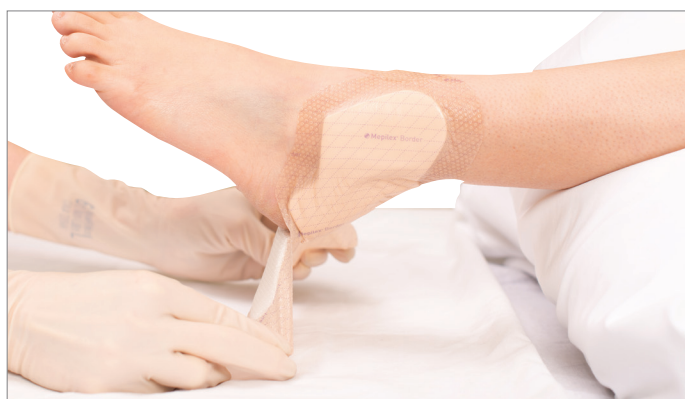
3. Tout en maintenant le pansement sur le bord proximal de « A » (voir photo), évaluer l'état de la peau.