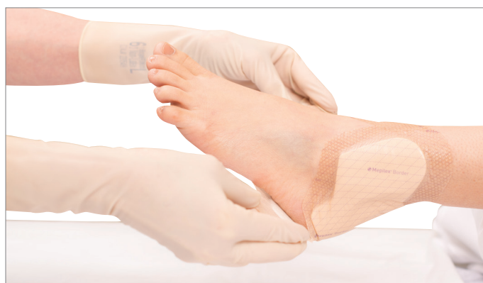
4. Réappliquer la mousse et la bordure du pansement. S'assurer que les rabats sont placés sur les rabats de cheville.