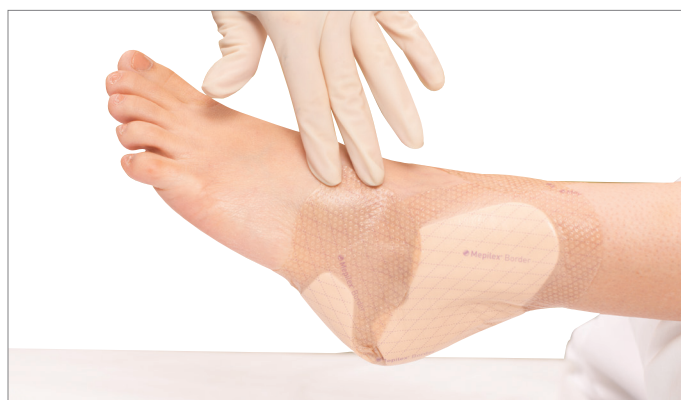
6. Appuyer et lisser le pansement pour s'assurer que l'ensemble du pansement entre en contact avec la peau.