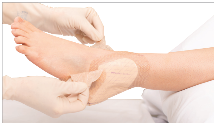
1. Tirer doucement sur les languettes de manipulation pour détacher le pansement de la peau.