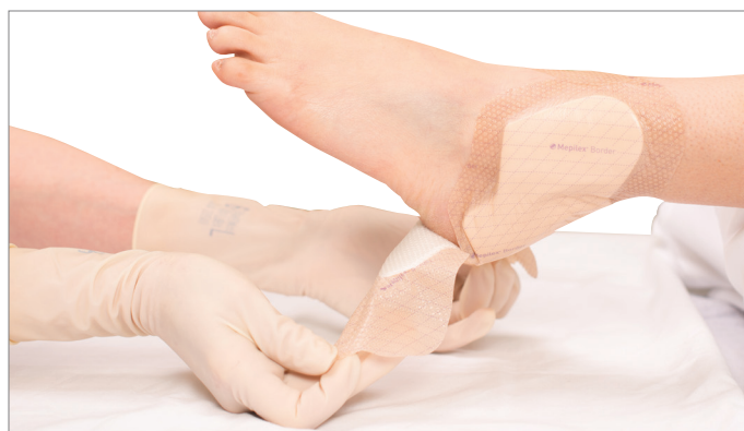
2. Continuer à détacher le pansement de la peau à l'aide des languettes de manipulation jusqu'à ce que la peau soit exposée pour permettre de vérifier celle-ci.