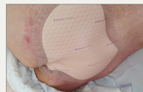
Aplicación de Mepilex Border Sacrum