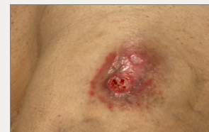
Día 23: Mejoría de ambas lesiones