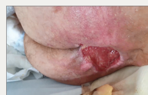
Día 4: No hay signos de eritema en la piel perilesional. El paciente es dado de alta y se va a otra institución