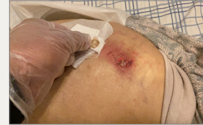
Inicio, UPP categoría II, tratamiento previo con gasa y compresa de vaselina