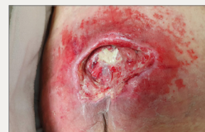
Día 0: Inicio del tratamiento