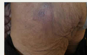
Día 50: Herida completamente cicatrizada, sin ningún signo de eritema no blanqueable