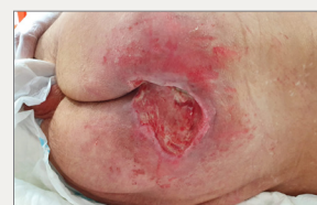
Día 2: Mejora sustancial de la piel perilesional, con reducción del eritema y limpieza del lecho de la herida