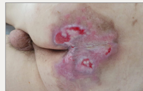
Día 14: Reducción significativa de la zona lesionada, sin maceración, infección u otras complicaciones